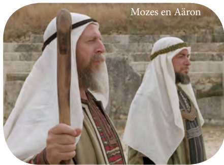
Mozes en Aäron

- boven het bloed iets eten (Lev. 19:26 - in het Hebreeuws: "over het bloed eten"), een vorm van chthonische afgoderij (op de aarde gerichte afgoderij), waarbij bloed in de aarde stroomt om geesten van overledenen op te roepen