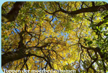
Toppen der moerbeziebomen

In de afgelopen jongerenbazuinen is er geprobeerd om de Eredienst uit te leggen, zodat je er meer van te weten komt en er meer bij betrokken raakt. Als je meer betrokken raakt bij de dienst, is het gelijk niet meer saai. Natuurlijk is het alsnog moeilijk te begrijpen, ook voor volwassenen. Maar we moeten begrijpen dat de dienst aan God belangrijk is. Je blijft er geestelijk gezond door, sterker nog: je ontvangt er het eeuwige leven.