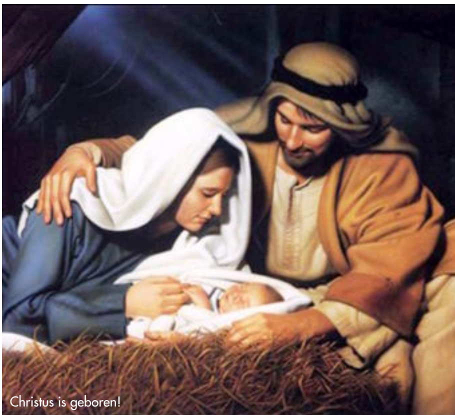
Christus is geboren!