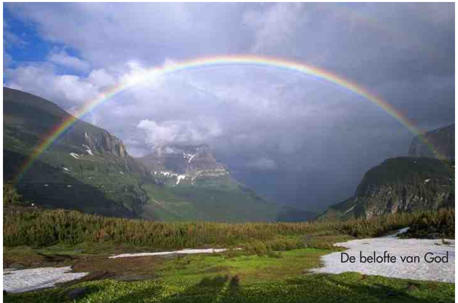
De belofte van God