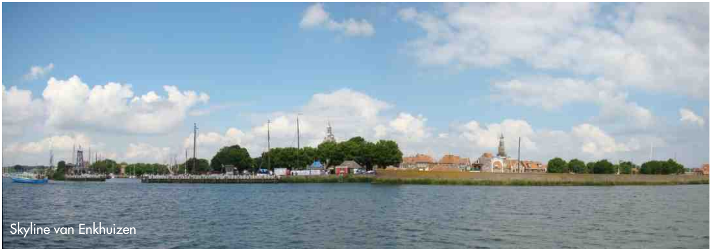
Skyline van Enkhuizen