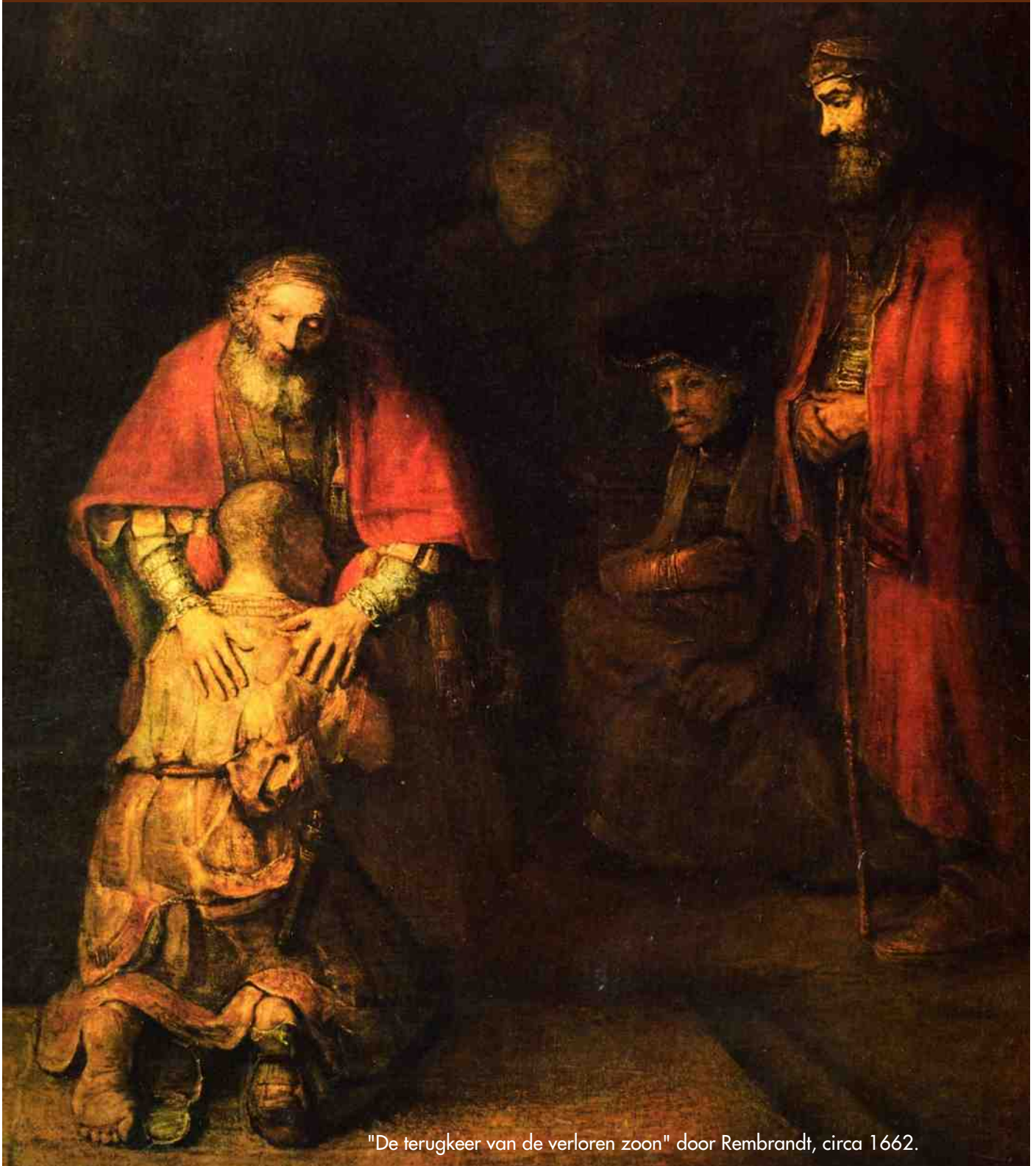
"De terugkeer van de verloren zoon" door Rembrandt, circa 1662.

20 En hij stond op en keerde naar zijn vader terug. En toen hij nog veraf was, zag zijn vader hem en werd met ontferming bewogen. En hij liep hem tegemoet, viel hem om de hals en kuste hem. 21 En de zoon zeide tot hem: Vader, ik heb gezondigd tegen de hemel en voor u, ik ben niet meer waard uw zoon te heten. 22 Maar de vader zeide tot zijn slaven: Brengt vlug het beste kled hier en trekt het hem aan en doet hem een ring aan zijn hand en schoenen aan zijn voeten.